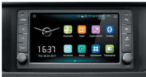
Современная мультимедиа система